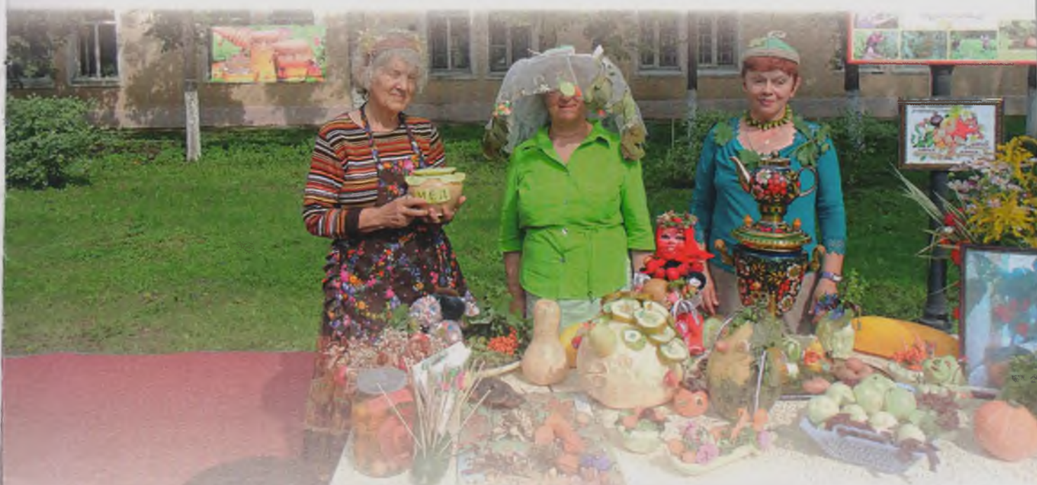
Конкурс «Лучший повар» в Арбузовском ПНИ.